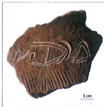
Fig. 36 VALEYRES-SOUS-RANCES – Sur le Moty. Détail du graffito des pots issus du comblement de la fosse St. 120.

métallique remontant au Moyen Âge et à l'époque moderne a été trouvé dans les couches supérieures.